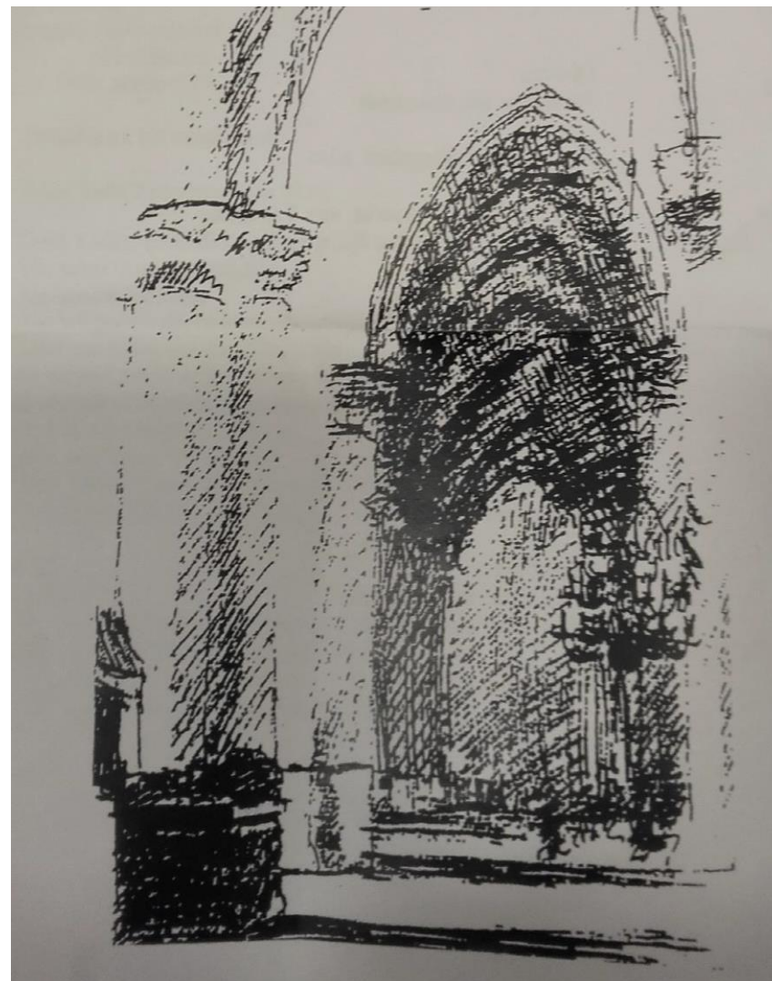
Oecumenisch Gebed voor Vrede en Verzoening Elke vrijdagmiddag 12:00 – 12:30 uur in de Grote Kerk Breda

In de komende jaren willen wij ons officieel aansluiten bij de wereldwijde Coventry-gemeenschap.